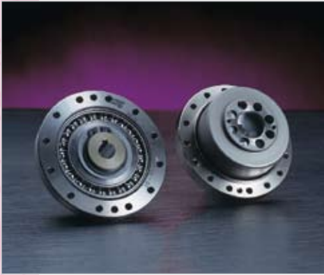
Abb. / Fig. 22.1