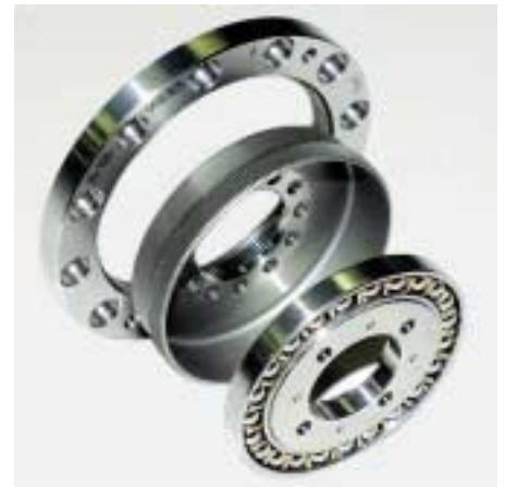
3: Die Getriebe vom Typ CSD zeichnen sich durch eine sehr kompakte Bauweise aus

Unsere Leser können sich ausführlicher über die neuen Getriebebaureihen informieren, indem sie die folgende Kennzahl in ihre Leserdienstkarte eintragen.