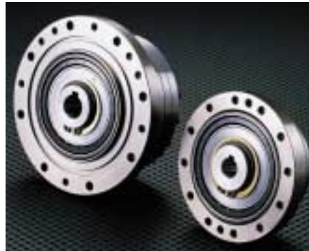
1: Die neuen Getriebe vom Typ CSG sind für Anwendungen im Handlings- und Robotikbereich prädestiniert

Zur Optimierung der Getriebe waren mehrere Maßnahmen erforderlich. Hierzu zählt neben der Oberflächenbehandlung der Verzahnung durch Nitrieren die deutliche Lebensdauersteigerung des Wave-Generator-Kugellagers um 40 %, die unter anderem durch eine gleichmäßigere Lastverteilung am Wave Generator erreicht wurde. Um eine gleichmäßigere Lastverteilung zu erzielen, wurde das Zahnprofil zusammen mit der Geometrie des Wave Generators optimiert. Auch neue Erkenntnisse im Bereich der Kugellagertechnik wurden bei der neuen Baureihe umgesetzt. Durch neue Wärmebehandlungsverfahren konnte die Verschleißfestigkeit der Oberfläche des Wave-Generator-Kugellagers deutlich verbessert werden. Dies führte neben einer höheren Tragfähigkeit (höhere Dreh-