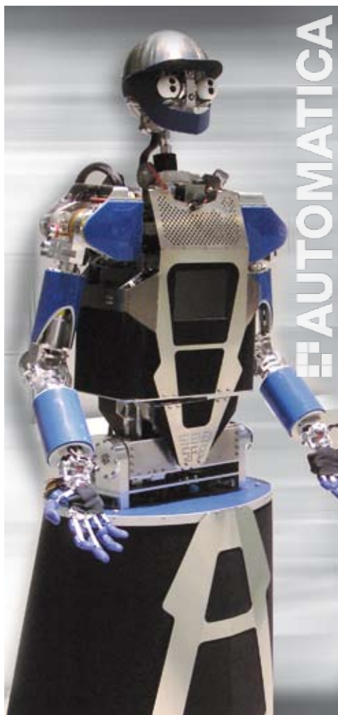
ARMAR III reagisce sia agli ordini verbali, sia ai gesti o al contatto tattile. La sua mobilità è garantita da Harmonic Drive.