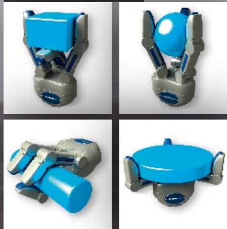
Mano di presa SDA (Schunk Dextrous Hand): La mano di presa a 3 dita, impiegata per il montaggio, la produzione e l'assistenza, con moduli snodati di Harmonic Drive.